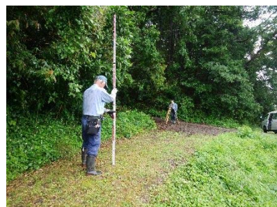
地形の高さの調査