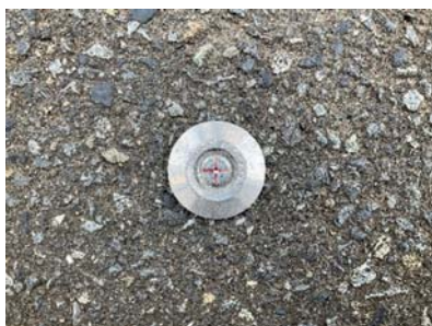
設置する基準点（鉄）