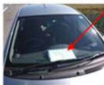
車両表示プレート